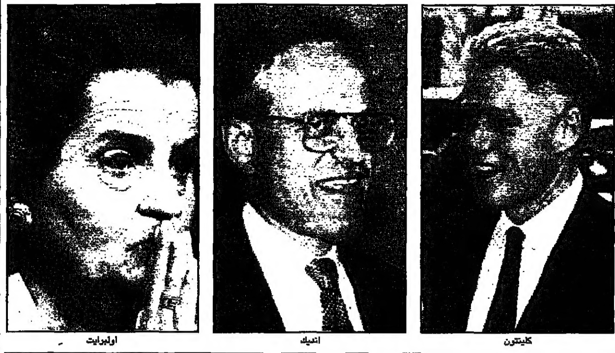
الافيا اليهودية - من محمد دلبح

ساختت اسمها على يد اللوبي اليهودي اللواتي لا تزال تسيطر على السياسة الخارجية لأمريكا منذ تأسيسها. وقد لعبت دوراً مهماً في تشكيل السياسة الخارجية الأمريكية منذ الحرب العالمية الثانية. وقد لعبت دوراً مهماً في تشكيل السياسة الخارجية الأمريكية منذ الحرب العالمية الثانية. وقد لعبت دوراً مهماً في تشكيل السياسة الخارجية الأمريكية منذ الحرب العالمية الثانية. استراتيجيا حيث حصل على شهادة الدكتوراه في الاقتصاد من جامعة سيني في عام 1972 وشهادة الدكتوراه من جامعة كولومبيا في عام 1977. له مؤلفات عديدة من السياسات الأمريكية تجاه عملية السلام العربية-الإسرائيلية. وهو من مناصبي كبار مسؤولي وزارة الشؤون الخارجية في عهد الرئيس رونالد ريغان. وقد عمل في عهد الرئيس رونالد ريغان في وزارة الخارجية في عهد الرئيس رونالد ريغان. وقد عمل في عهد الرئيس رونالد ريغان في وزارة الخارجية في عهد الرئيس رونالد ريغان.